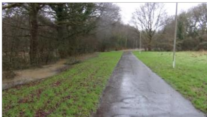
piste cyclable dans le parc Les Monts Gaultier le 29/01/2025