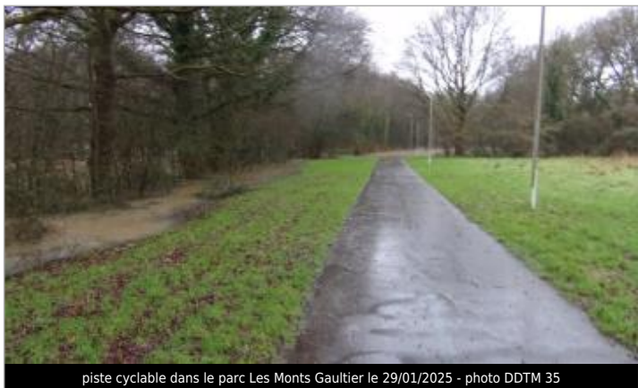
piste cyclable dans le parc Les Monts Gaultier le 29/01/2025

GÉNÉRAL Code : SPC_35206_034_2025 Date de mise à jour : 13/10/2025 Auteur : SPC VCB