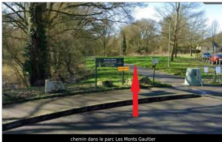
chemin dans le parc Les Monts Gaultier

Coordonnées WGS84 : X: -1.67642477 / Y: 48.03676600