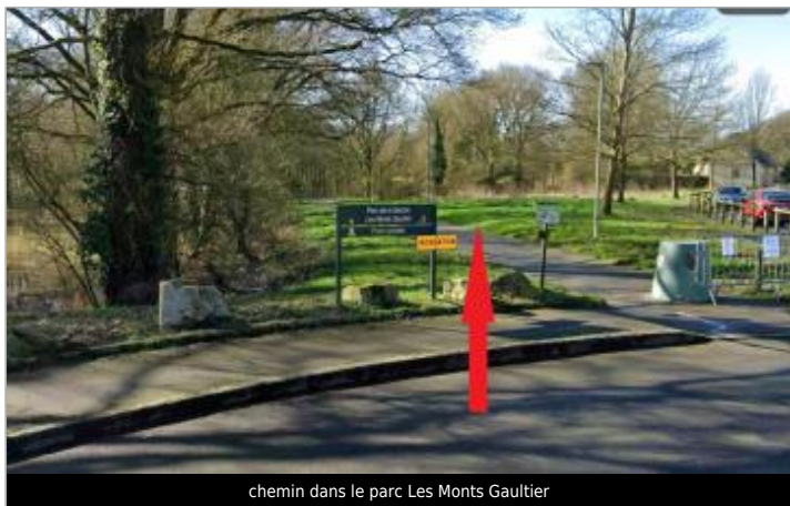
chemin dans le parc Les Monts Gaultier

GÉOLOCALISATION Coordonnées WGS84 : X: -1.67642477 / Y: 48.03676600 Coordonnées RGF93 (Lambert 93) X: 351679.82 / Y: 6781026.62 Coordonnées RGF93 (ETRS89) : X: -1.6764248 / Y: 48.036766 Code Hydro: J74-0300 Rive de référence: Droite