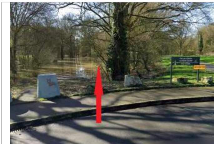
chemin (noyé sur la photo) dans le parc Les Monts Gaultier