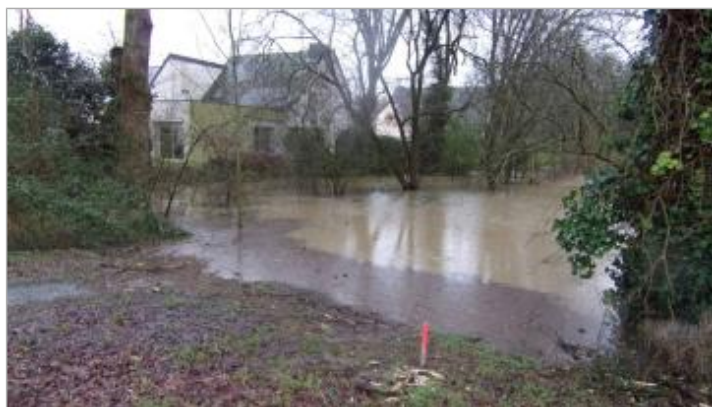
Laisse d'inondation dans l'allée Simone Signoret le 29/01/2025