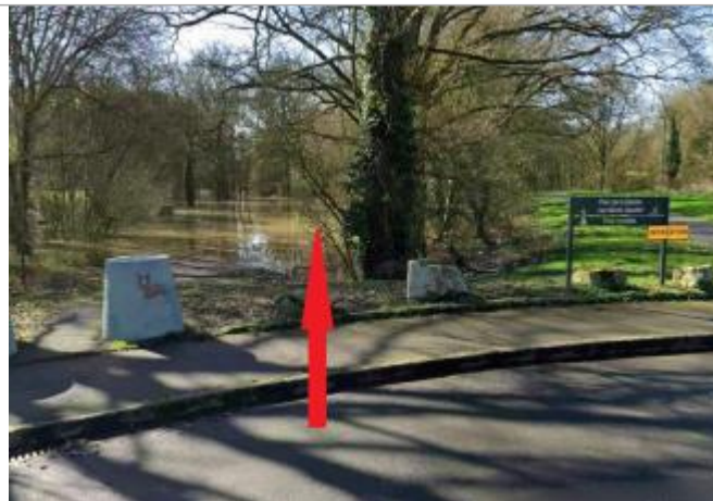
chemin (noyé sur la photo) dans le parc Les Monts Gaultier

Coordonnées WGS84 : X: -1.67569172 / Y: 48.03738800