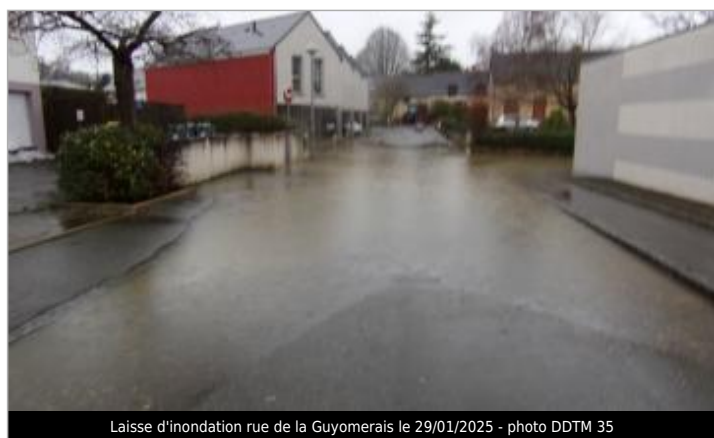
Laisse d'inondation rue de la Guyomerais le 29/01/2025 - photo DDTM 35

SOURCE DE REPÉRAGE : RENNES MÉTROPOLE RELEVÉS LAISSES 2025 - 28/02/2025