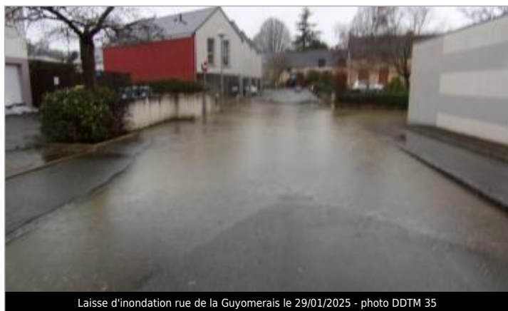
Laisse d'inondation rue de la Guyomerais le 29/01/2025