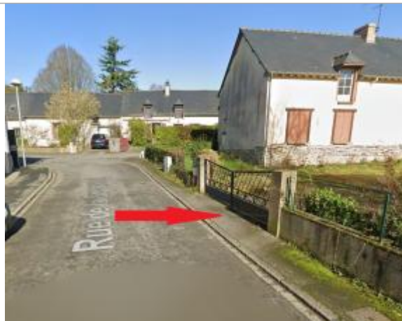
Devant le portail du n°11 rue de la Guyomerais

Coordonnées WGS84 : X: -1.67455460 / Y: 48.03869830