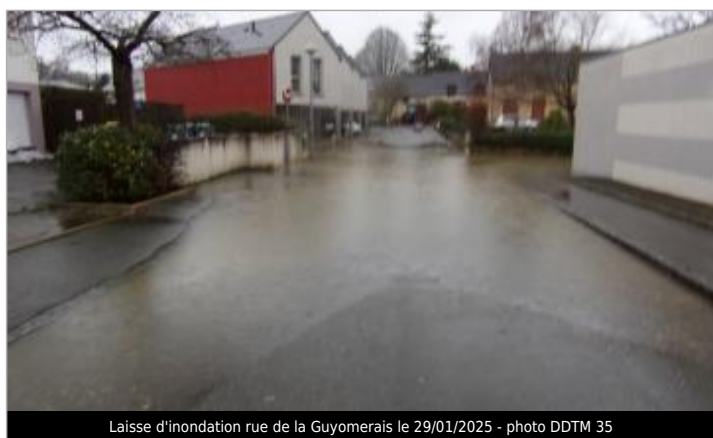
Laisse d'inondation rue de la Guyomerais le 29/01/2025