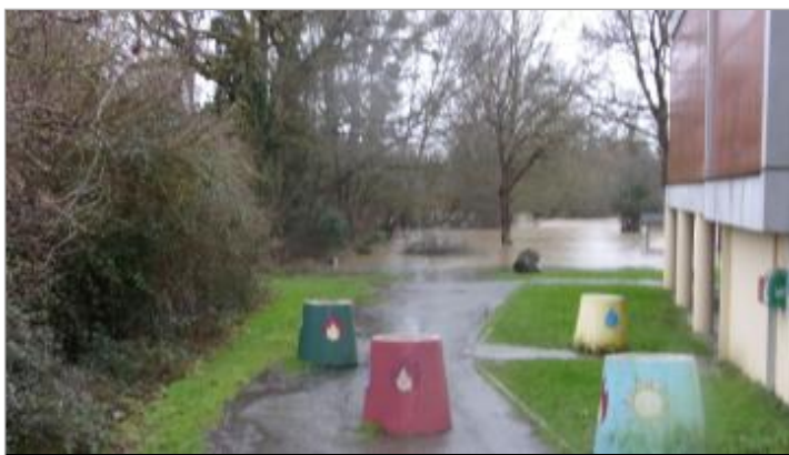
Espace Jeunes le 29/01/2025 - photo DDTM 35