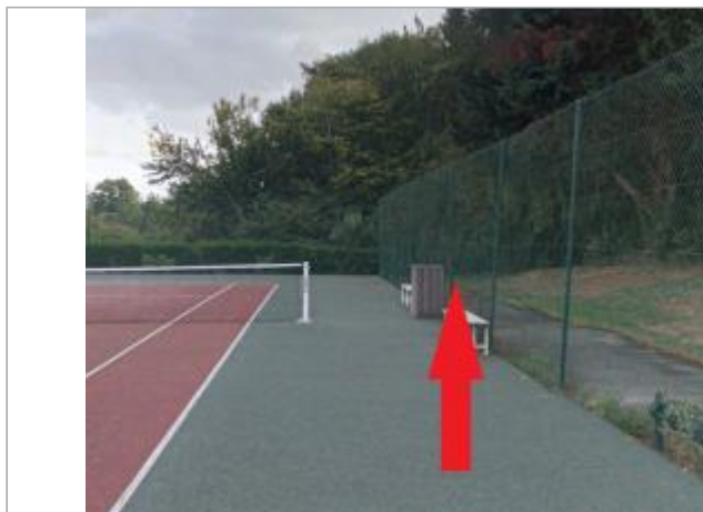
En contrebas des terrains de tennis

Coordonnées WGS84 : X: -1.66553148 / Y: 48.03894160