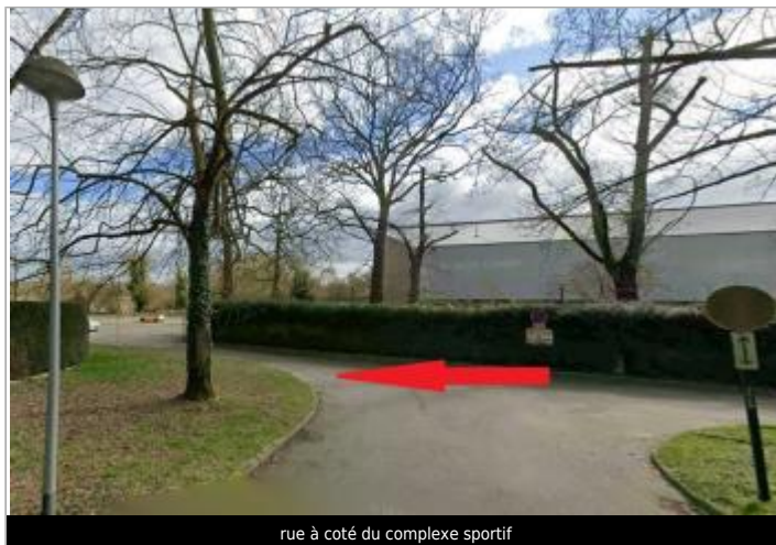
rue à coté du complexe sportif