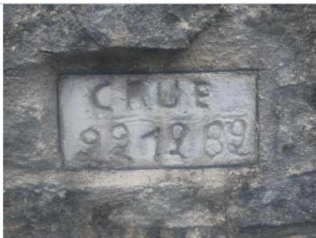
Vue sur la marque de crue gravée

Altitude calculée de l'eau (en m) : 72.86