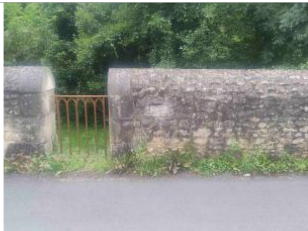
Vue sur le muret rue des 4 roues