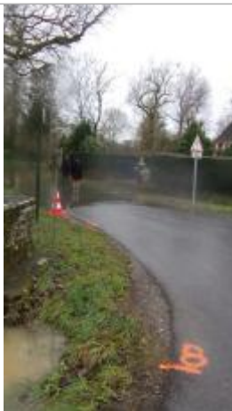
bord de la rue au pied du calvaire le 29/01/2025

Altitude calculée de l'eau (en m) : 21.347 m