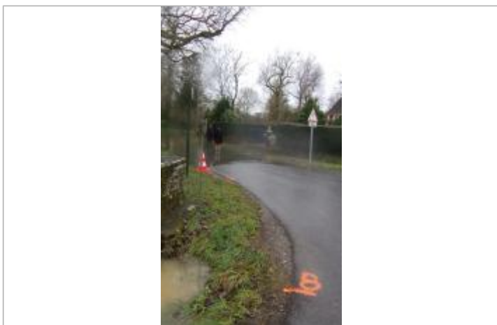
bord de la rue au pied du calvaire le 29/01/2025

Maximum de l'inondation : Oui Visibilité : Non État du repère : Disparu Pérennité : Aucune Repère calculé : Non PHEC : Oui