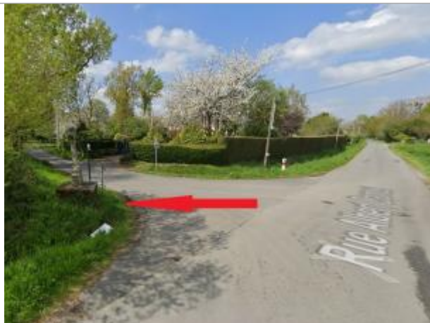
calvaire à l'intersections des rues Albert Camus et le Pâtis Malais