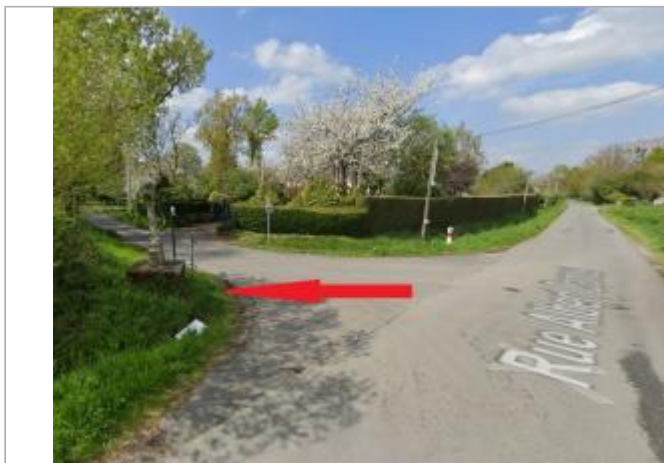
calvaire à l'intersections des rues Albert Camus et le Pâtis Malais