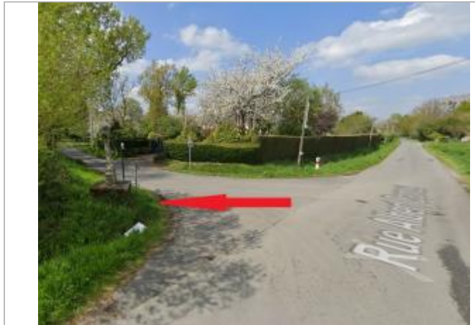
calvaire à l'intersections des rues Albert Camus et le Patis Malais

Coordonnées WGS84 : X: -1.66911355 / Y: 48.03414350