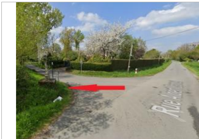
calvaire à l'intersections des rues Albert Camus et le Patis Malais

Coordonnées WGS84 : X: -1.66911355 / Y: 48.03414350