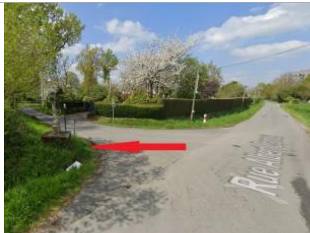
calvaire à l'intersections des rues Albert Camus et le Pâtis Malais