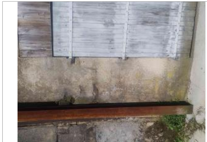
Vue sur le support (entre le pilier de soutien et le volet)

Coordonnées WGS84 : X: 0.33937800 / Y: 46.59115100