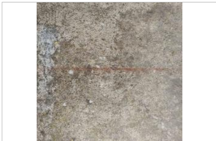
Vue sur le trait rouge

Altitude calculée de l'eau (en m) : 71.31