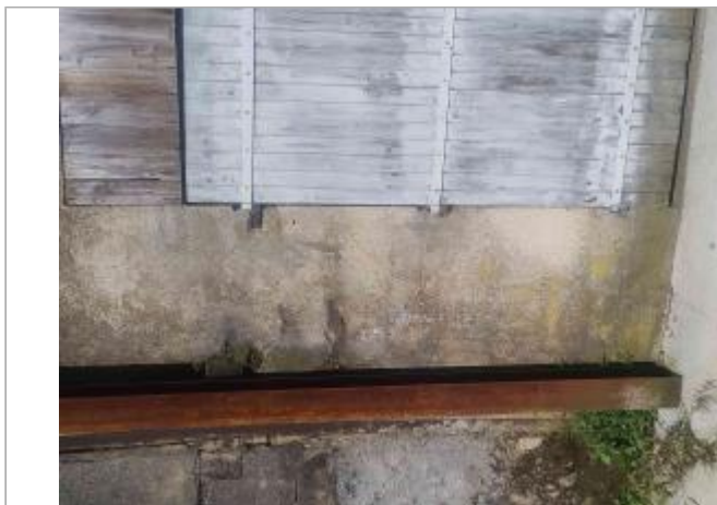
Vue sur le support (entre le pilier de soutien et le volet)

Coordonnées WGS84 : X: 0.33937800 / Y: 46.59115100