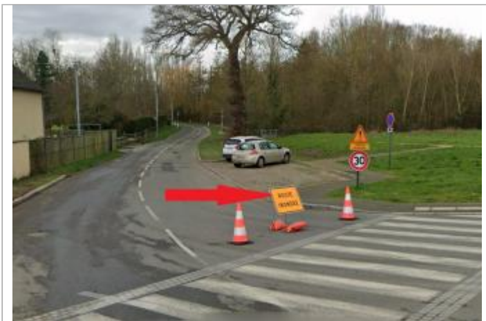
parking au début de la route de la petite rivière