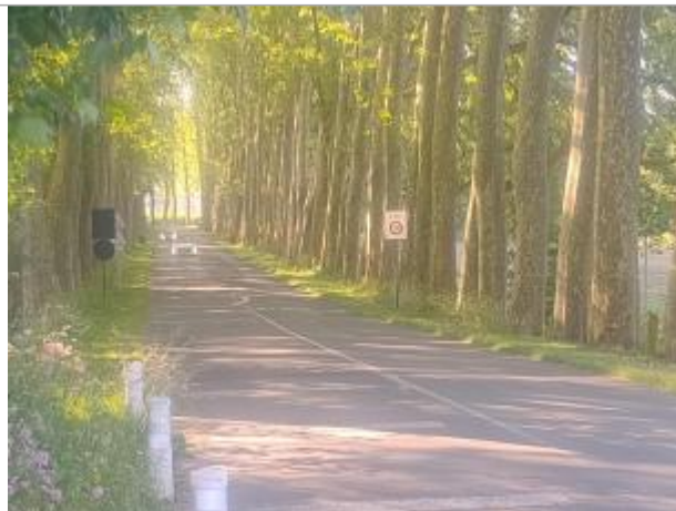
Vue sur l'allée/Levée des Platanes