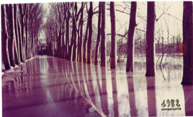
La Levée des Platanes lors de la crue de 1982

Organisme(s) : Etablissement public du bassin de la Vienne