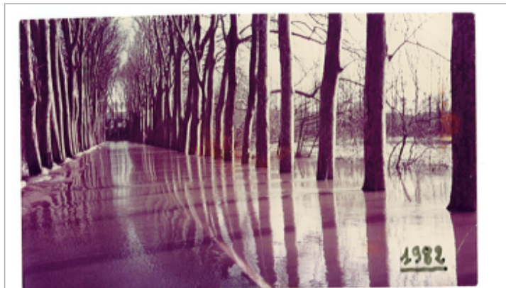
La Levée des Platanes lors de la crue de 1982

Maximum de l'inondation : Non renseigné Visibilité : Oui État du repère : Disparu Pérennité : Aucune Repère calculé : Non PHEC : Oui