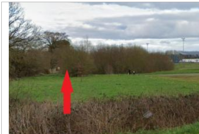
Chemin en contrebas de la salle omnisports