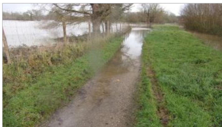
Chemin d'éco-paturage en contre-bas de la salle omnisports le 29/01/2025