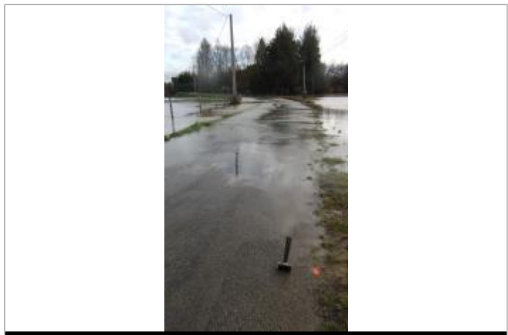
route de Brais le 30/01/2025

GÉNÉRAL Code : SPC_35206_007_2025 Date de mise à jour : 09/10/2025 Auteur : SPC VCB