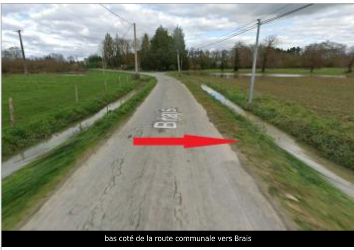
bas coté de la route communale vers Brais

GÉOLOCALISATION Coordonnées WGS84 : X: -1.65568942 / Y: 48.02836440 Coordonnées RGF93 (Lambert 93) X: 353167.47 / Y: 6780003.35 Coordonnées RGF93 (ETRS89) : X: -1.6556894 / Y: 48.0283644 Code Hydro: J7474000 Rive de référence: Gauche