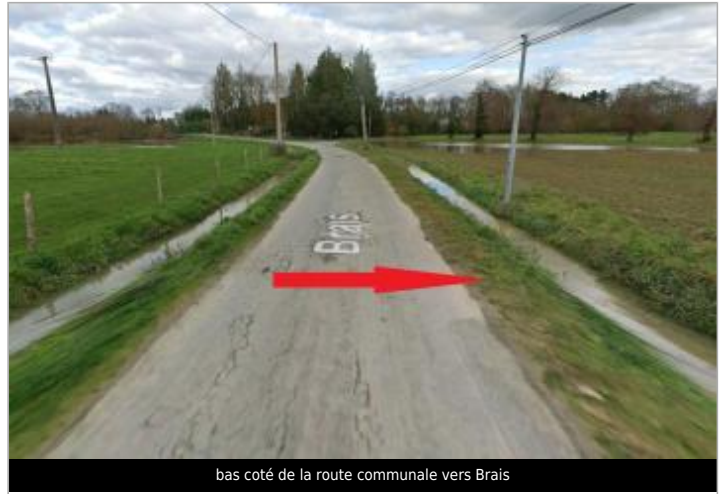
bas coté de la route communale vers Brais

Coordonnées WGS84 : X: -1.65568942 / Y: 48.02836440