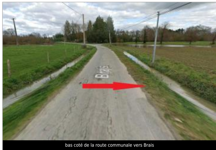
bas coté de la route communale vers Brais

GÉOLOCALISATION Coordonnées WGS84 : X: -1.65568942 / Y: 48.02836440 Coordonnées RGF93 (Lambert 93) X: 353167.47 / Y: 6780003.35 Coordonnées RGF93 (ETRS89) : X: -1.6556894 / Y: 48.0283644 Code Hydro: J7474000 Rive de référence: Gauche