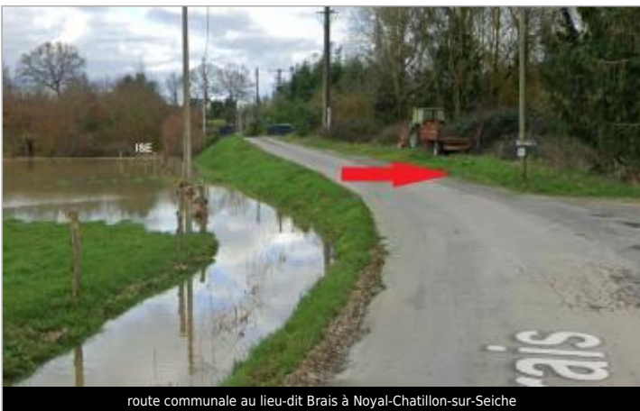
route communale au lieu-dit Brais à Noyal-Chatillon-sur-Seiche

GÉOLOCALISATION Coordonnées WGS84 : X: -1.65499825 / Y: 48.02846510 Coordonnées RGF93 (Lambert 93) X: 353219.56 / Y: 6780011.49 Coordonnées RGF93 (ETRS89) : X: -1.6549983 / Y: 48.0284651 Code Hydro: J7474000 Rive de référence: Gauche