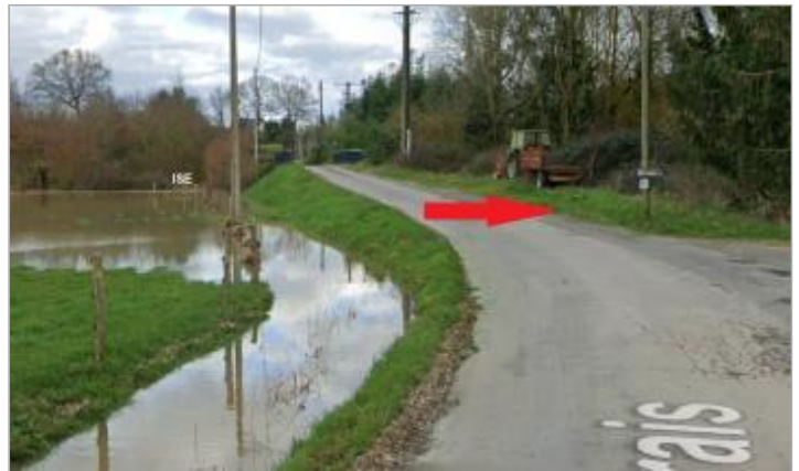
route communale au lieu-dit Brais à Noyal-Chatillon-sur-Seiche

Coordonnées WGS84 : X: -1.65499825 / Y: 48.02846510