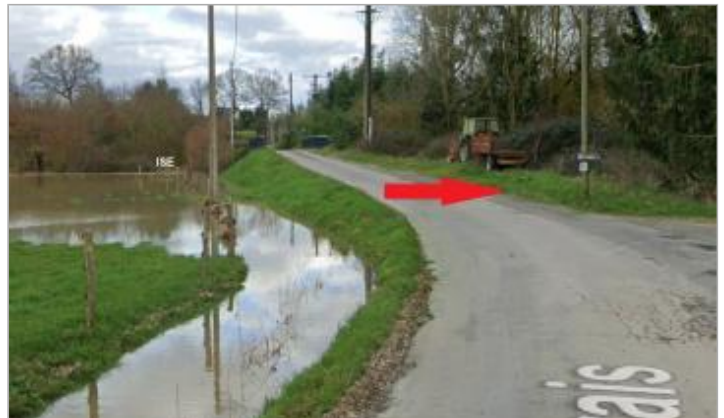
route communale au lieu-dit Brais à Noyal-Chatillon-sur-Seiche

Coordonnées WGS84 : X: -1.65499825 / Y: 48.02846510