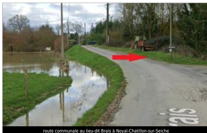
route communale au lieu-dit Brais à Noyal-Chatillon-sur-Seiche

GÉOLOCALISATION Coordonnées WGS84 : X: -1.65499825 / Y: 48.02846510 Coordonnées RGF93 (Lambert 93) X: 353219.56 / Y: 6780011.49 Coordonnées RGF93 (ETRS89) : X: -1.6549983 / Y: 48.0284651 Code Hydro: J7474000 Rive de référence: Gauche