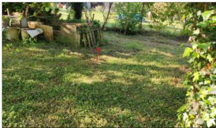
Vue sur le muret