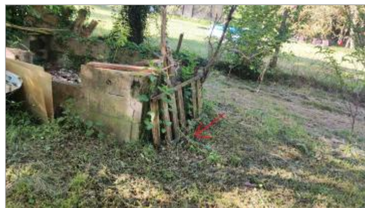
Vue sur le muret (parpaing)