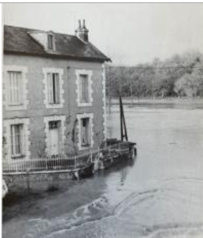
Photographie de l'habitation (1982)

Organisme : Etablissement public du bassin de la Vienne