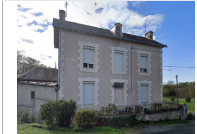
Vue sur l'habitation

Coordonnées WGS84 : X: 0.25940945 / Y: 46.42150820