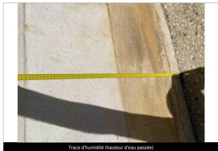
Trace d'humidité (hauteur d'eau passée)

MARQUE Maximum de l'inondation : Non renseigné Visibilité : Oui État du repère : Moyen Pérennité : Moyenne Repère calculé : Non PHEC : Oui