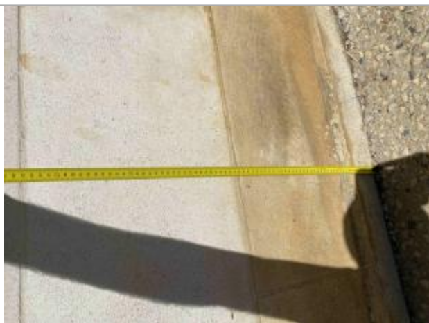
Trace d'humidité (hauteur d'eau passée)

Organisme : Etablissement public du bassin de la Vienne