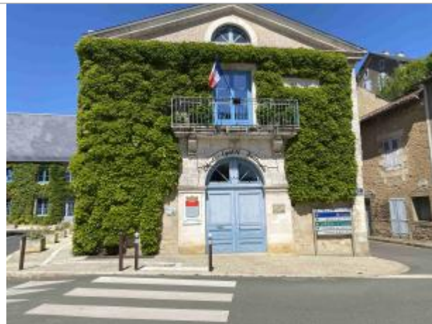
Vue sur la façade de la mairie (côté passage piéton)