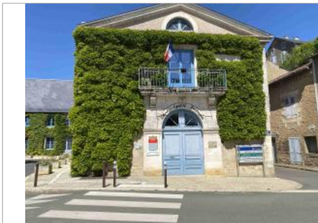
Vue sur la façade de la mairie (côté passage piéton)

Coordonnées WGS84 : X: 0.25869204 / Y: 46.42625830