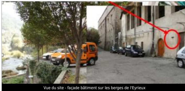
Vue du site - façade bâtiment sur les berges de l'Eyrieux