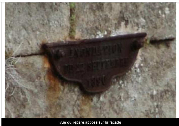
vue du repère apposé sur la façade

Texte : inondation du 22 septembre 1890 Maximum de l'inondation : Oui Visibilité : Oui État du repère : Moyen Pérennité : Longue