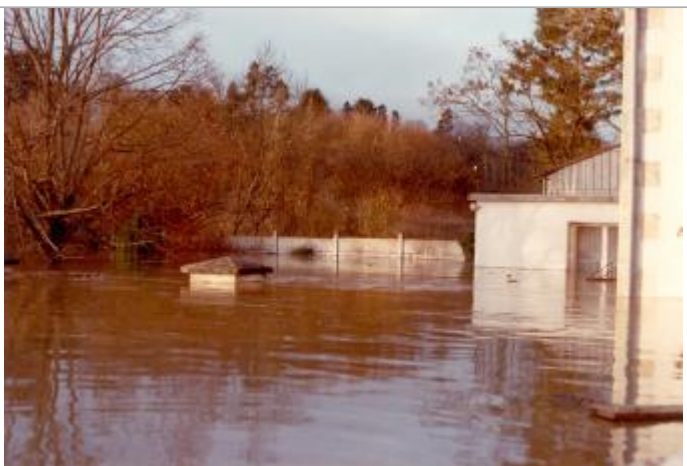
Vue sur le pilier en 1982

Organisme(s) : Etablissement public du bassin de la Vienne