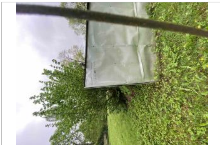
Cabane du jardin