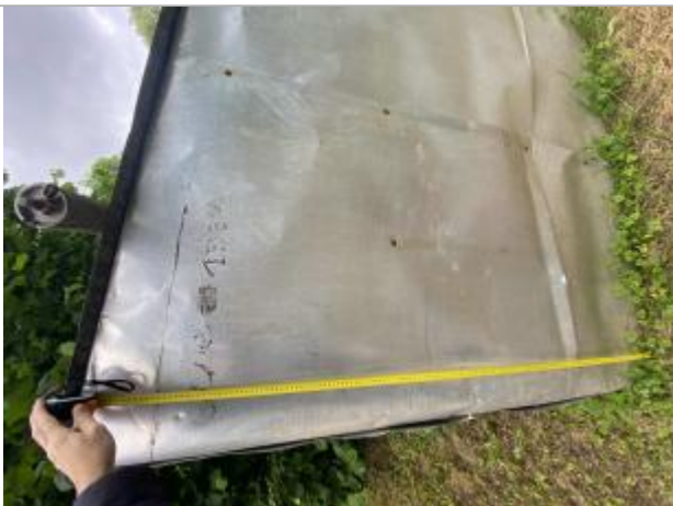
Photographie de SMAR01

Organisme : Etablissement public du bassin de la Vienne