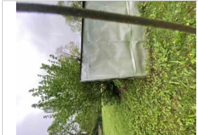
Cabane du jardin

Coordonnées WGS84 : X: 0.34246200 / Y: 46.52132700