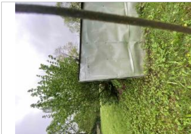
Cabane du jardin

Coordonnées WGS84 : X: 0.34246200 / Y: 46.52132700