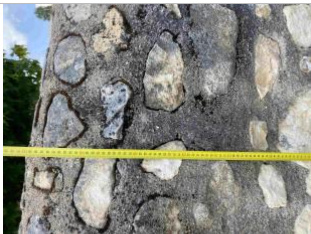
Photographie du mur (CIVA15)

Organisme(s) : Etablissement public du bassin de la Vienne