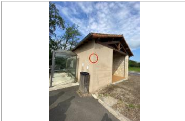
WC public (côté parking)