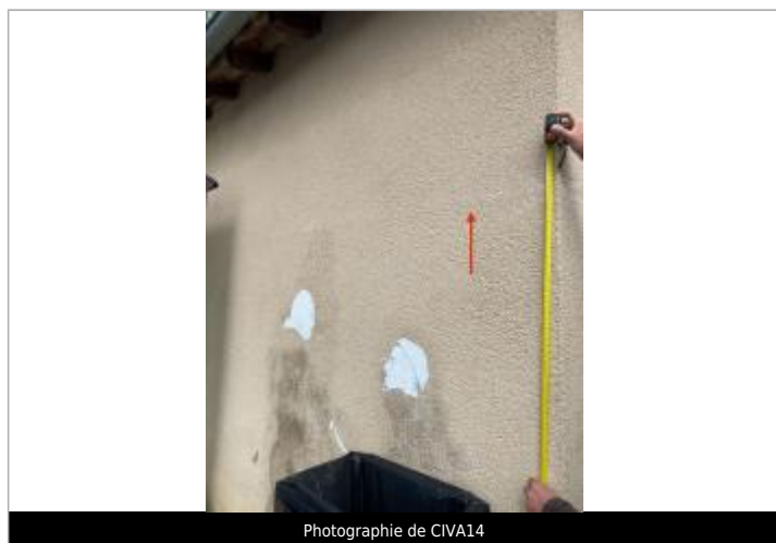
Photographie de CIVA14

SOURCE DE REPÉRAGE : RECENSEMENT DES REPÈRES DE CRUES PAR L'EPTB VIENNE - PHASE OPÉRATIONNELLE DU PAPI VIENNE-CLAIN - 10/04/2025