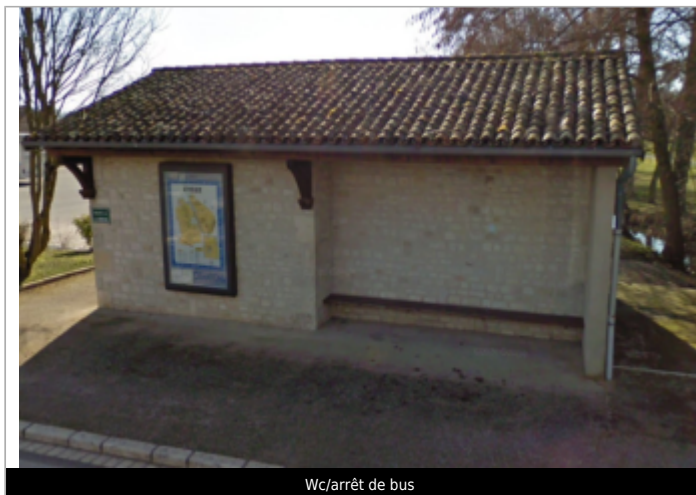
Wc/arrêt de bus

Coordonnées WGS84 : X: 0.66171900 / Y: 46.44460000