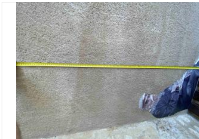
Photographie de CIVA07

SOURCE DE REPÉRAGE : RECENSEMENT DES REPÈRES DE CRUES PAR L'EPTB VIENNE - PHASE OPÉRATIONNELLE DU PAPI VIENNE-CLAIN - 10/04/2025