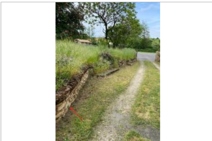
Muret au 4 route du fond d'Orveau

GÉOLOCALISATION Coordonnées WGS84 : X: 0.66206900 / Y: 46.44512700 Coordonnées RGF93 (Lambert 93) X: 520550.44 / Y: 6596562.85 Coordonnées RGF93 (ETRS89) : X: 0.662069 / Y: 46.445127 Code Hydro: L1414000 Rive de référence: Droite