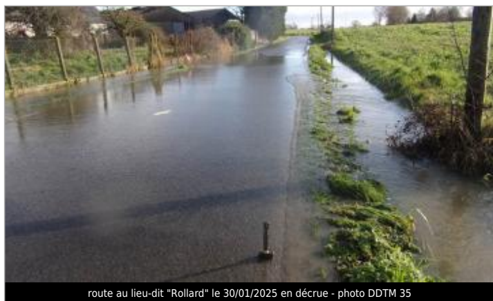
route au lieu-dit "Rollard" le 30/01/2025 en décrue

SOURCE DE REPÉRAGE : RENNES MÉTROPOLE RELEVÉS LAISSES 2025 - 28/02/2025