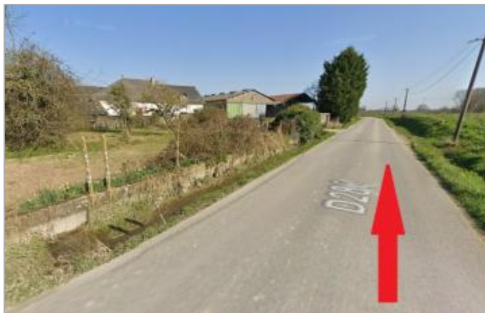
Chaussée de la RD 286 au lieu-dit Rollard