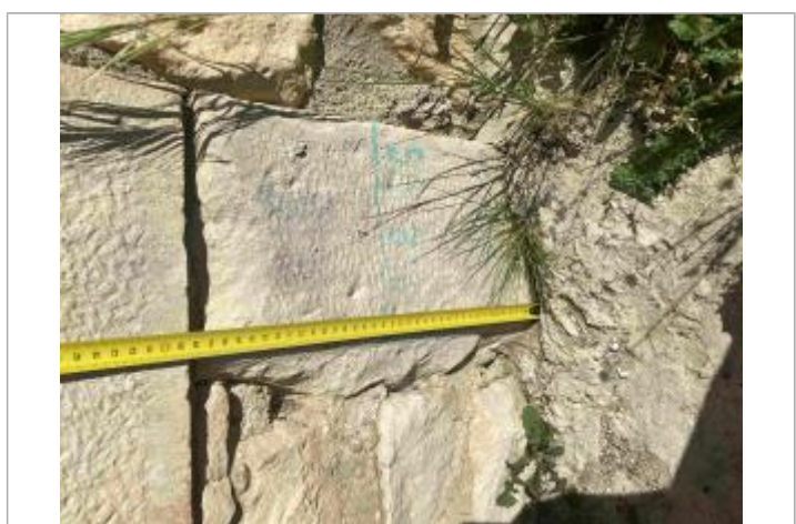
Photographie de CIVA01

MARQUE Texte : 2.2.95 Maximum de l'inondation : Oui Visibilité : Non État du repère : Moyen Pérennité : Moyenne Repère calculé : Non PHEC : Non