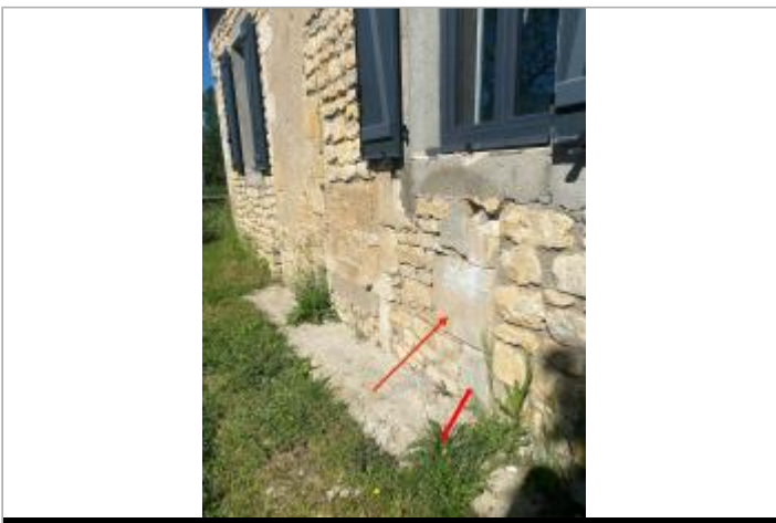
Site - façade du 4 Route du fond d'Orveau

GÉOLOCALISATION Coordonnées WGS84 : X: 0.66200355 / Y: 46.44514340 Coordonnées RGF93 (Lambert 93) X: 520545.47 / Y: 6596564.82 Coordonnées RGF93 (ETRS89) : X: 0.6620036 / Y: 46.4451434 Code Hydro: L1414000 Rive de référence: Droite