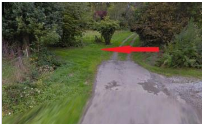
Début du chemin de la Tertronais vers la Seiche

Coordonnées WGS84 : X: -1.54986765 / Y: 48.02196060