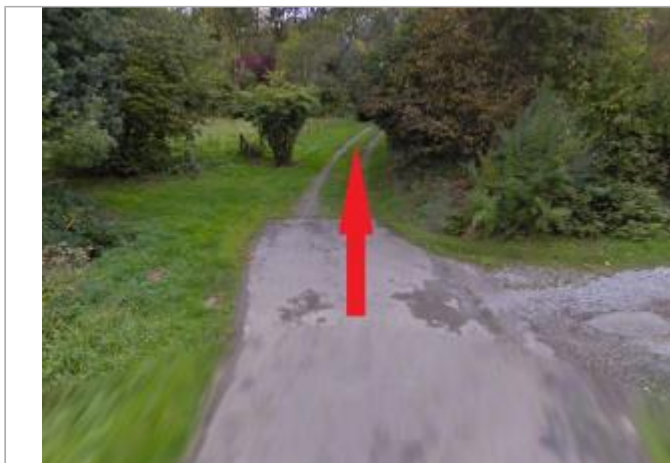
Chemin vers la Seiche à la Tertronais