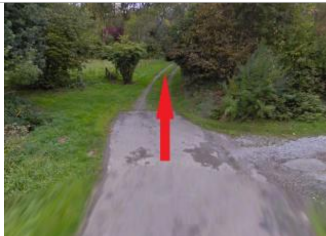
Chemin vers la Seiche à la Tertronais

Coordonnées WGS84 : X: -1.55007577 / Y: 48.02215790