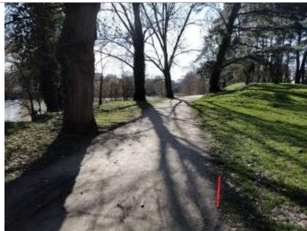
chemin de berge de la Vilaine le long du parc Dézerseul