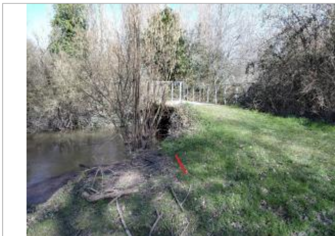
En aval de la passerelle dans le golf de Tizé

Coordonnées WGS84 : X: -1.58622196 / Y: 48.13330840