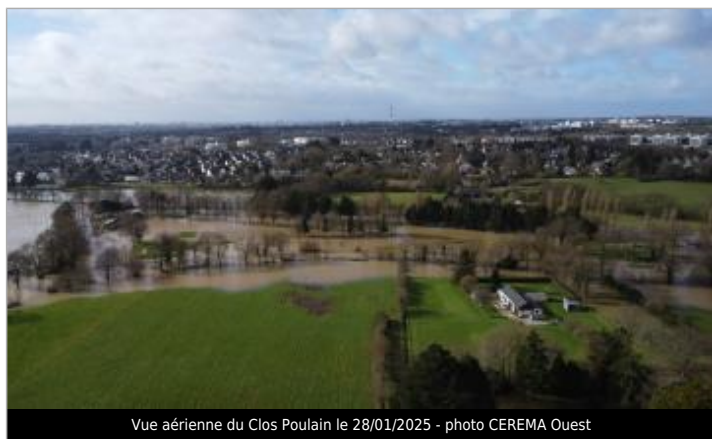
Vue aérienne du Clos Poulain le 28/01/2025