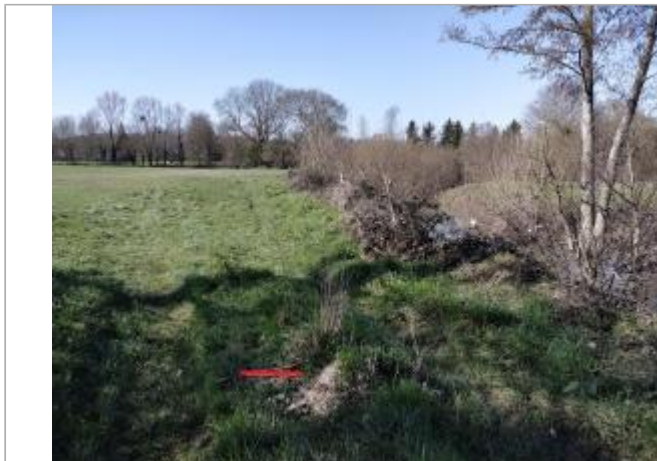
rive gauche du bras gauche de la Vilaine en aval du pont de la rocade Est

Coordonnées WGS84 : X: -1.58025014 / Y: 48.13576130