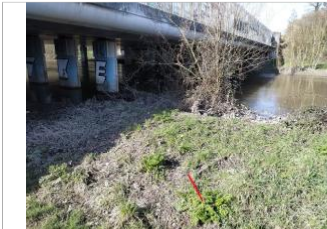
En amont du pont de la rocade Est, rive gauche