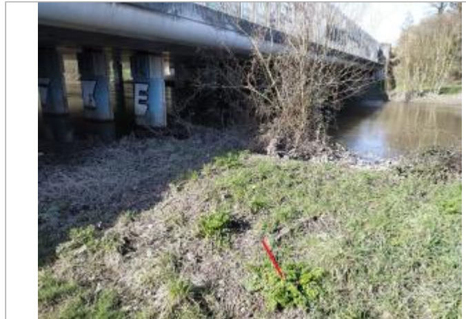
En amont du pont de la rocade Est, rive gauche