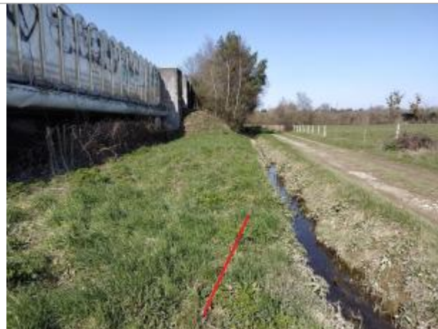
chemin bordant la rocade Est de l'agglomération rennaise

Coordonnées WGS84 : X: -1.57614896 / Y: 48.13635470