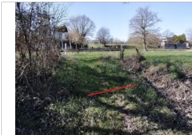
Limite inondée chemin au lieu-dit Le vault Martin