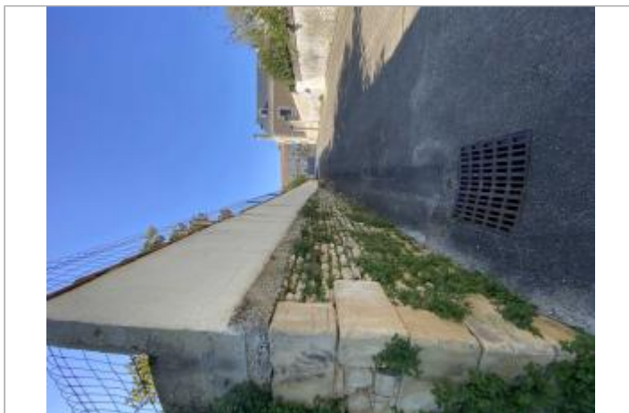
Impasse de l'Abreuvoir