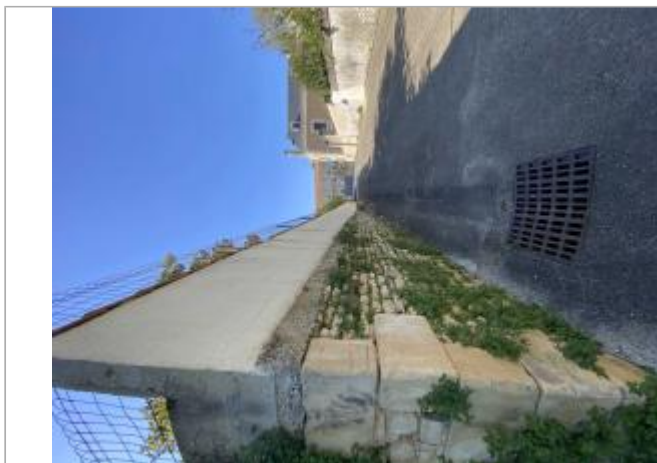
Impasse de l'Abreuvoir