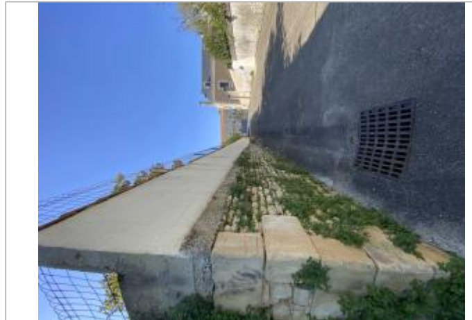
Impasse de l'Abreuvoir

Coordonnées WGS84 : X: 0.37637745 / Y: 46.65009970