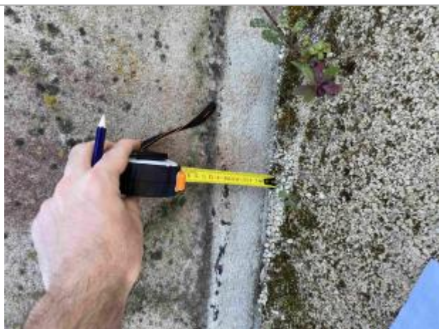
Photographie de CHAS02

SOURCE DE REPÉRAGE : RECENSEMENT DES REPÈRES DE CRUES PAR L'EPTB VIENNE - PHASE OPÉRATIONNELLE DU PAPI VIENNE-CLAIN - 10/04/2025