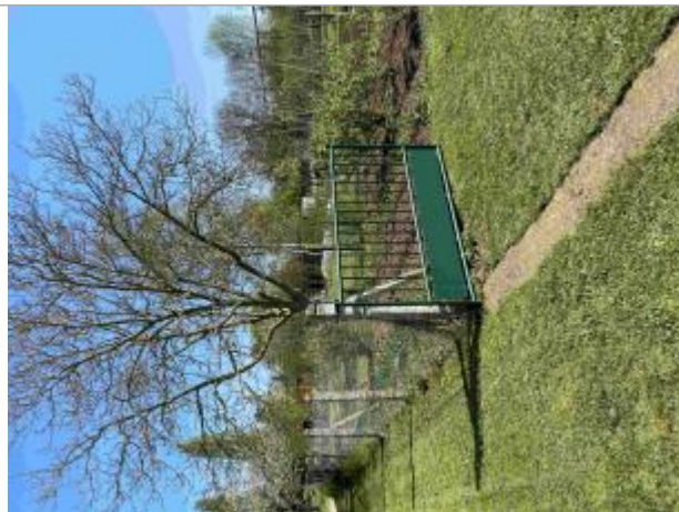
Vue sur le portail d'un jardin privé, repère visuel lors de crue du Clain