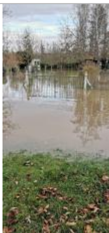
Photographie du repère CHAS01