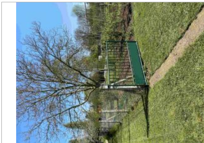
Vue sur le portail d'un jardin privé, repère visuel lors de crue du Clain