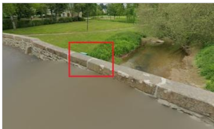
Amont du pont de Pacé sur la Flume

Code : RC FLU 2_2025 Date de mise à jour : 13/08/2025 Auteur : SPC VCB