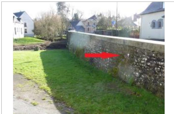
muret de protection rue du Dct Léon